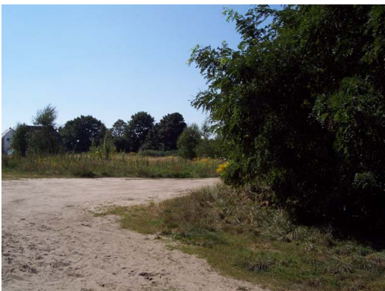
Blick nach Südwesten in Richtung Torweg