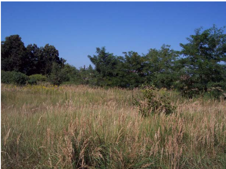
Blick nach Norden in Richtung Löwenmaulsteig