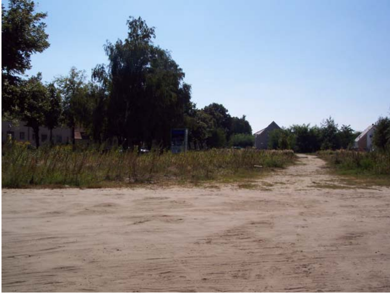
Blick nach Süden in Richtung Torweg