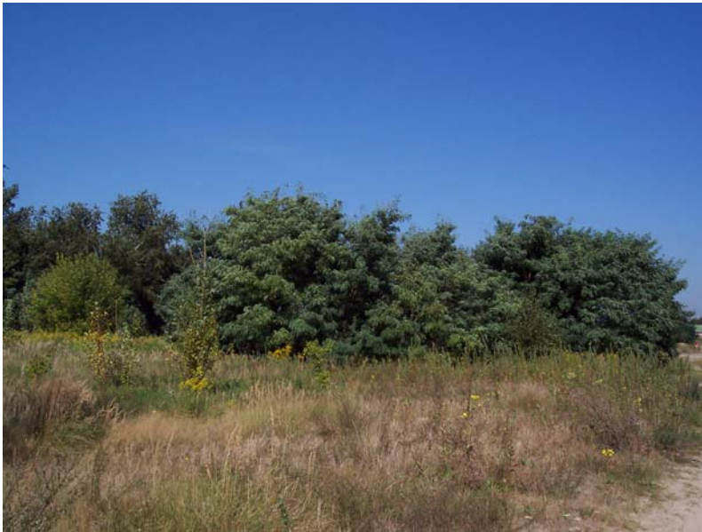
Blick nach Nordwesten in Richtung Lowenmaulsteig, Robinien-Vorwald ( Robinia pseudoacacia )