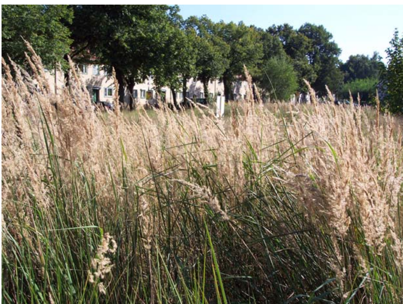
Landreitgras-Dominanzbestände ( Calamagrostis epigeios )