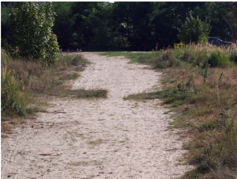
Blick nach Südosten in Richtung Torweg