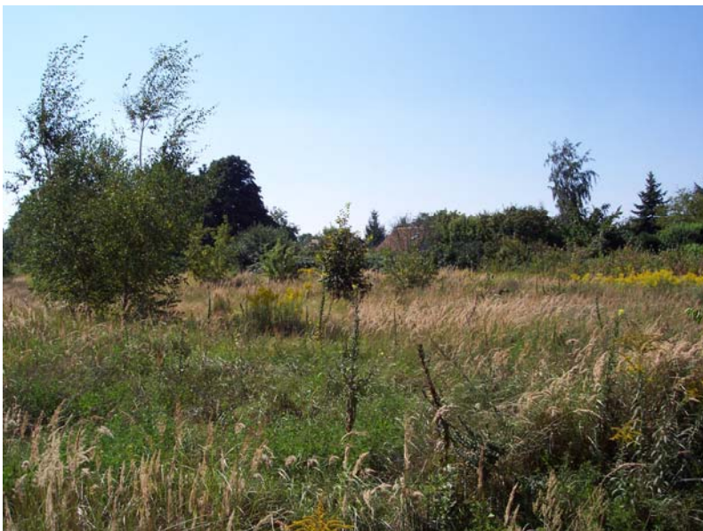
Blick nach Sudwesten in Richtung Torweg, Verbuschungsstadium mit Hange-Birke ( Betula pendula )