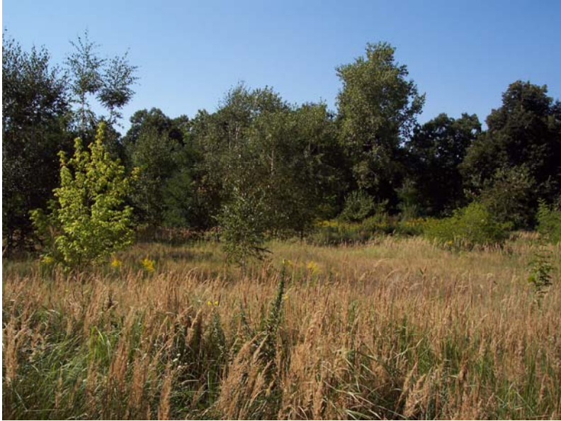
Blick nach Nordwesten in Richtung Löwenmaulsteig