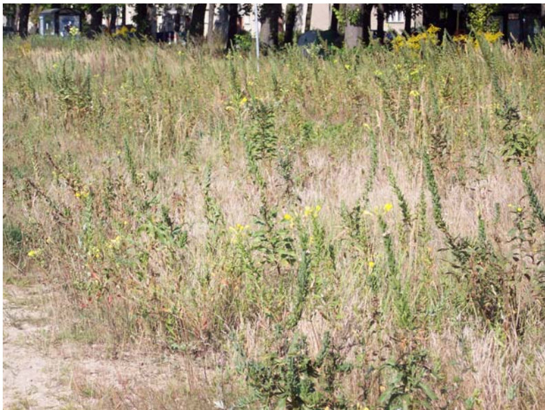
Gehäuftes Vorkommen der Gemeinen Nachtkerze ( Oenothera biennis )