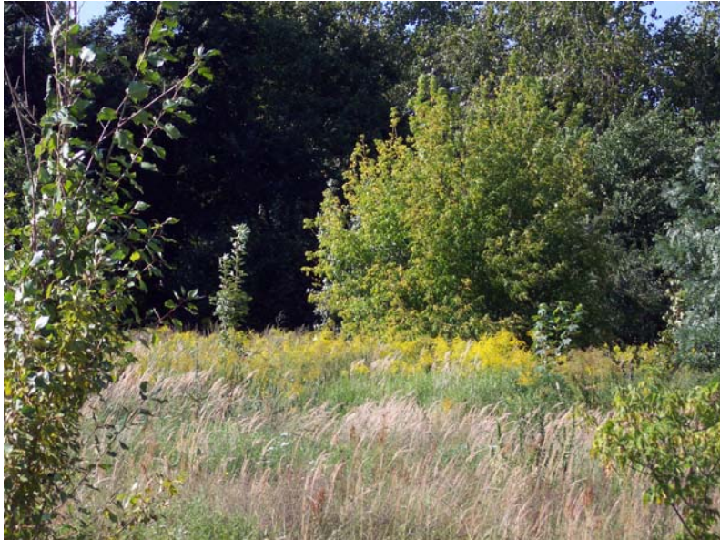
Goldruten-Dominanzbestände ( Solidago canadensis/ gigantea )